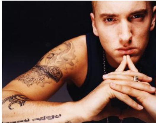
Nelle foto il famosissimo rapper americano che vende milioni di dischi all'anno