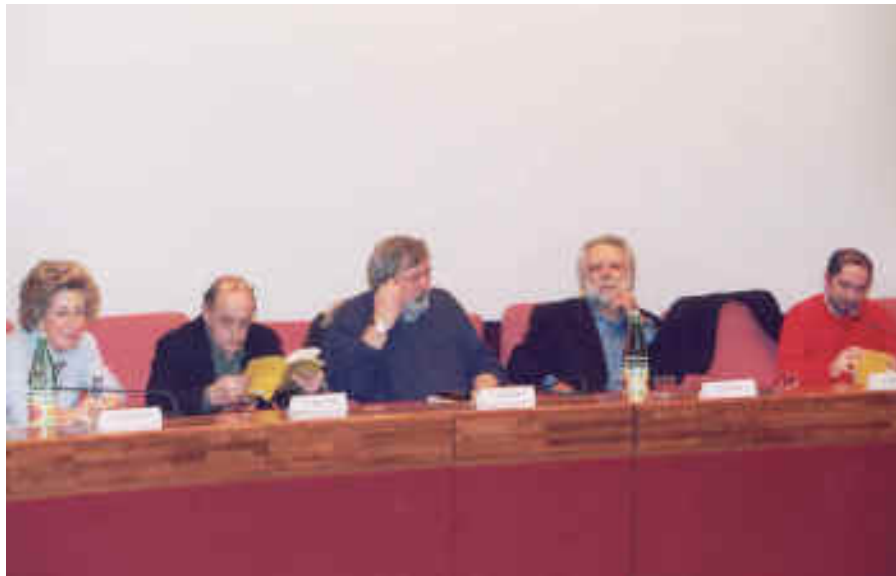
Nelle foto: un momento dell'incontro nell'aula Magna (sopra) Guccini mentre si esibisce in concerto (a destra)