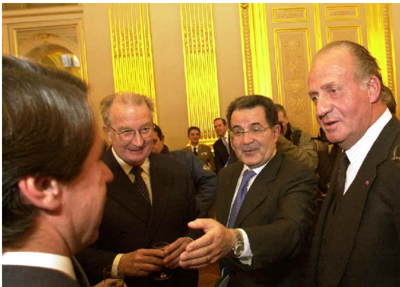
Nella foto il Presidente della Commissione Europea Prodi (al centro) con lo spagnolo Aznar (di spalle) ed i sovrani Alberto II (a destra) e Juan Carlos (a sinistra).

In Gran Bretagna Blair è letteralmente sommerso dalle critiche e dal peso delle sue bugie. In Spagna Aznar ha già avuto il benservito dal suo popolo ed è stato sconfitto alle elezioni politiche per aver voluto la guerra contro la volontà del novanta per cento degli Spagnoli e per aver maldestramente voluto attribuire all' ETA la responsabilità della strage di Madrid, ignorando volutamente tutti gli indizi e le rivendicazioni vere e proprie. Francia. E' stata contro la guerra. Ma: sacrifici a senso unico, smantellamento dello stato sociale, attacco alla scuola pubblica ed alle garanzie e ai diritti dell' uomo e del cittadino di cui essa è stata la culla nel Settecento illuministico e nei secoli successivi han fatto sì che nelle elezioni regionali del 28 marzo al turno di ballottaggio in 20 regioni su 22 hanno vinto la sinistra ed i suoi alleati. Lo stesso Valéry Giscard d' Estain, già presidente della repubblica e presidente dell' assemblea costituente europea recentemente, è stato battuto da un' esordiente. Tira brutta aria per le destre in Europa e nel mondo. Spagna, Francia, a giugno le amministrative e le europee in Italia, a novembre le presidenziali americane. Bush e Berlusconi si sentono proprio tranquilli? O certi comportamenti sono spia involontaria del loro nervosismo? Promesse non mantenute: minimo un milione al mese ai pensionati, riduzione del carico fiscale per tutti, non solo per i più ricchi, come è